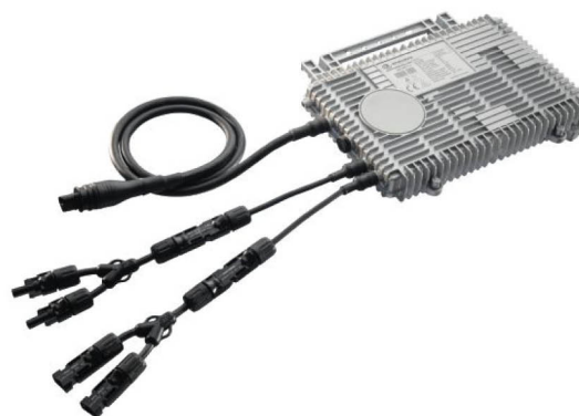
Микроинвертор Enecsys SMI-D360W-72