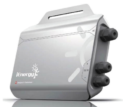
Микроинвертор i-Microinverter GT 260 DE