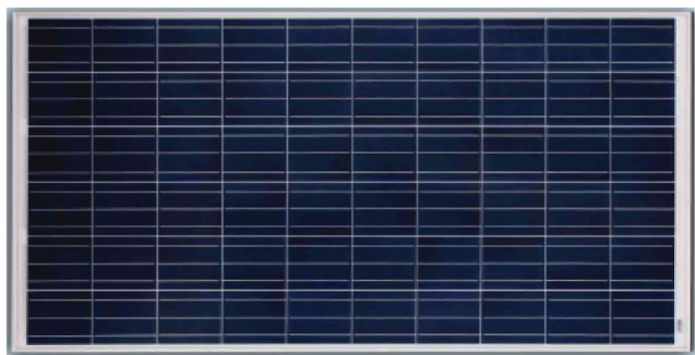
PV Модул JA Solar JAP6-60-255 W