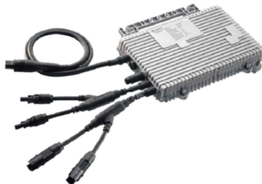
Микроинвертор Enecsys SMI-D480W-60