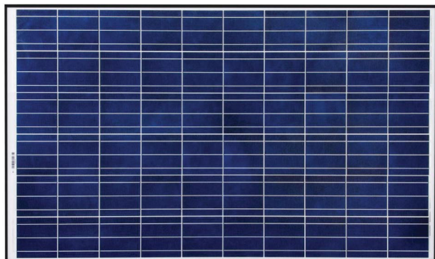
PV Модул Sunmodule+ SW 240 poly