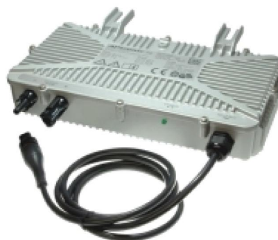
Микроинвертор INV250 - 45EU - BG