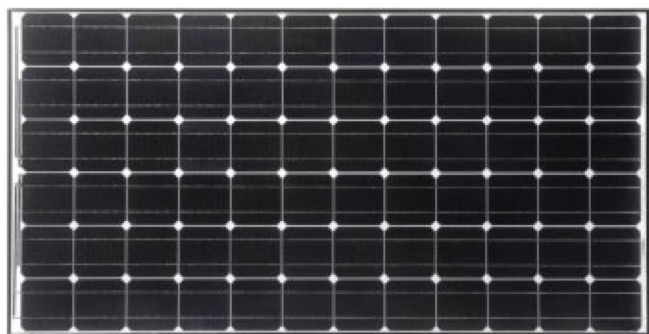
PV Модул Sanyo HIT-205DNKHE1