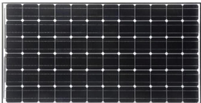
PV Модул Sanyo HIT-205DNKHE1