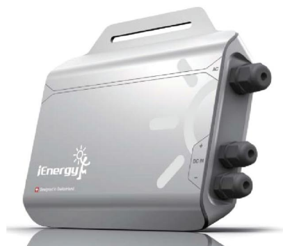
Микроинвертор i-Microinverter GT 260 DE