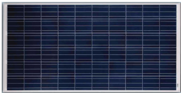
PV Модул JA Solar JAP6-60-255 W