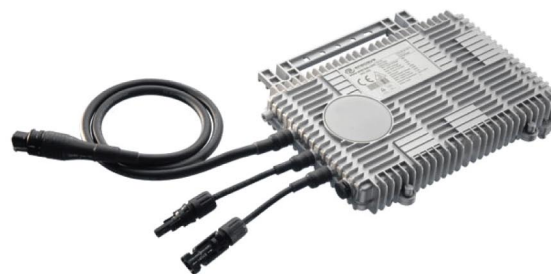
Микроинвертор Enecsys SMI-S240W-60