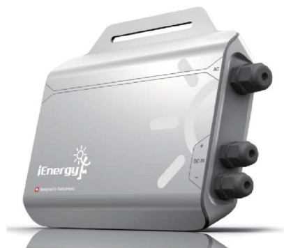
Микроинвертор i-Microinverter GT 260 DE