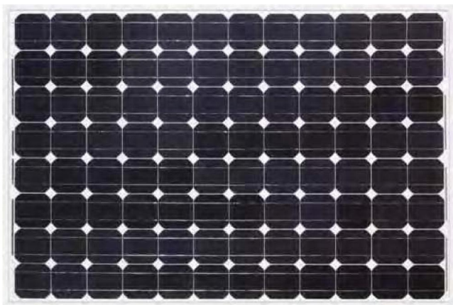
PV Модул Bosch Solar M235 Mono